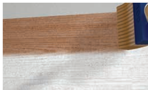
Okładzina StoCleyer W może być lazowana w kilkunastu odcieniach: od bieli, przez brązy, aż po czerń.